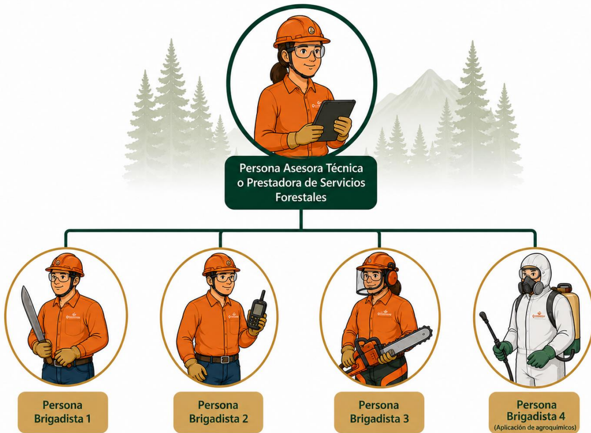
Figura 1. Integración de la Brigada de Saneamiento Forestal.

La adecuada integración de la Brigada de Saneamiento Forestal es un elemento fundamental para el cumplimiento de las actividades de monitoreo, diagnóstico y atención de plagas forestales. Para ello, la brigada deberá conformarse por personas que cuenten con las capacidades, conocimientos y condiciones necesarias para desarrollar las actividades operativas y técnicas previstas en el presente Manual.