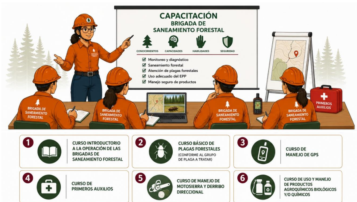
Figura 3. Capacitación de la Brigada de Saneamiento Forestal.

La capacitación permite fortalecer las capacidades técnicas y operativas de las personas integrantes de la brigada, contribuyendo a mejorar la seguridad durante las actividades en campo, el uso adecuado del Equipo de Protección Personal, el manejo seguro de productos biológicos y químicos cuando corresponda, así como el cumplimiento de los objetivos y metas establecidos.