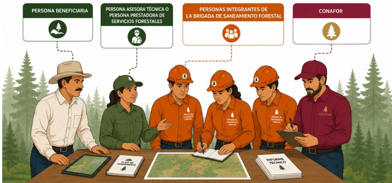
Figura 4. Coordinación de la Brigada de Saneamiento Forestal.

A continuación, se describen las actividades, procedimientos y responsabilidades que orientan la operación de las Brigadas de Saneamiento Forestal subsidiadas por la CONAFOR.