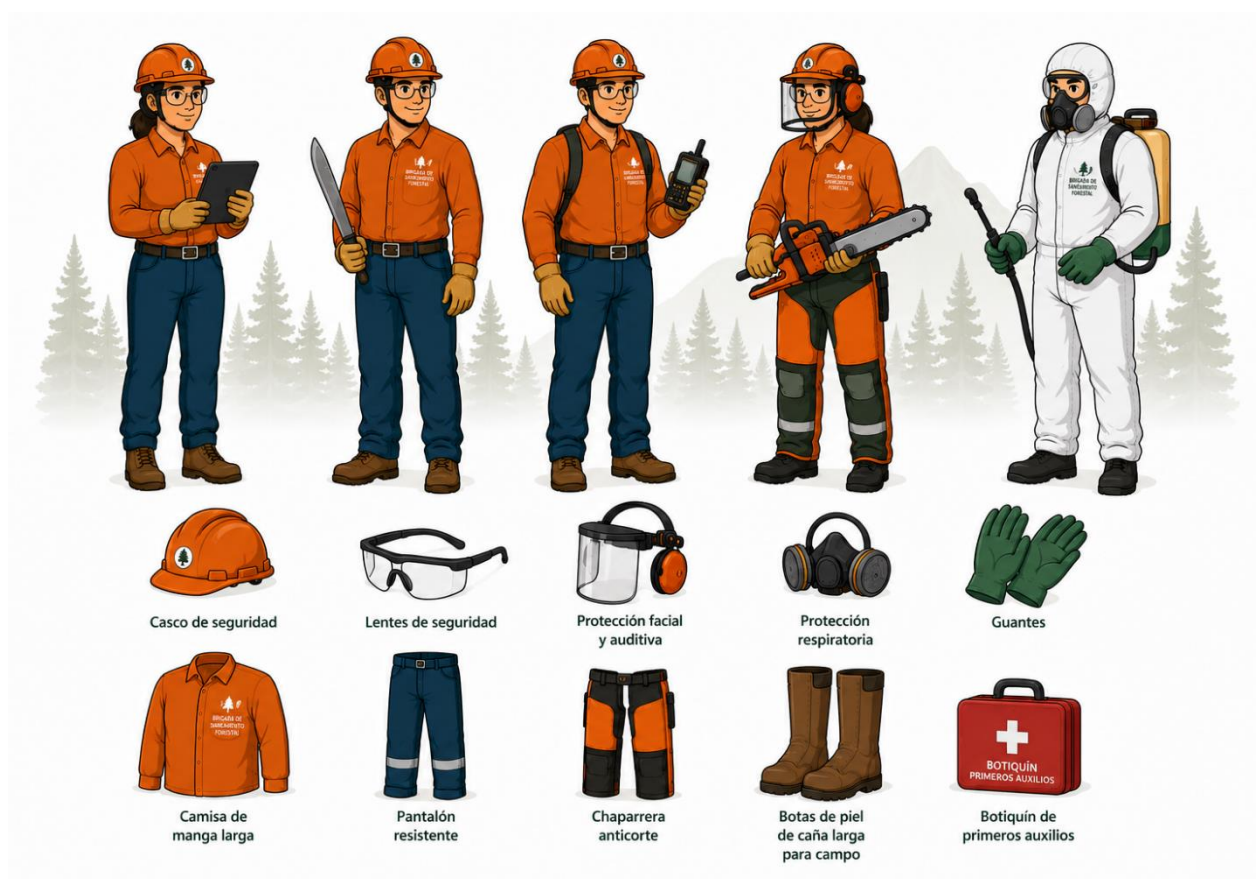
Figura 2. Equipamiento de la Brigada de Saneamiento Forestal.

Para el adecuado desarrollo de las actividades de monitoreo terrestre, diagnóstico fitosanitario y aplicación de tratamientos fitosanitarios, así como para contribuir a la seguridad de las personas integrantes de la brigada, es necesario contar con el equipo de protección personal, las herramientas, y los accesorios requeridos para la ejecución de dichas actividades.